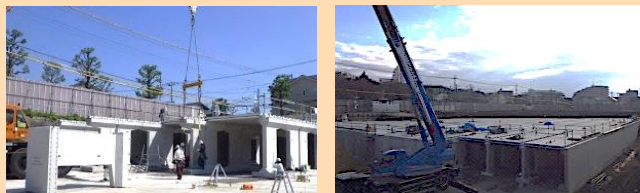
調整池工事の様子

調整池の容量をこれまでの約9,000m 3 から約20,000m 3 に拡張し、周辺エリア33haに対する雨水浸水対策を強化しました。また、調整池は地下式とし、上部は鶴間公園のグラウンドなどとして利用します。